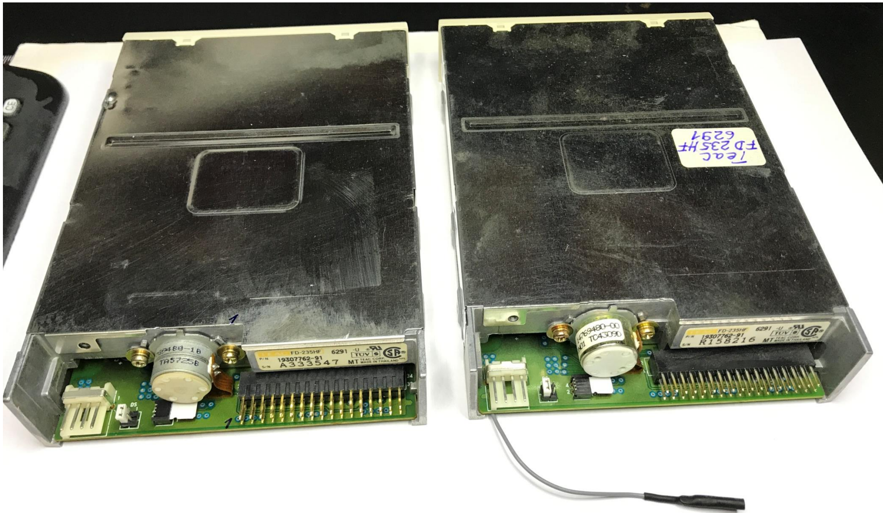
TEAC FD-235HF 6291-U_60B